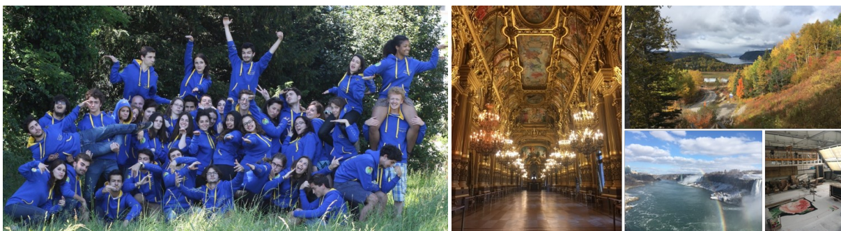
Bureau des Arts Audencia 2017 (gauche) et paysages de 2018 Grand Foyer du Palais Garnier, été indien et hiver canadien, ateliers de décors de l'Opéra Bastille

NB. Il faut savoir qu'à Audencia, l'année de césure est obligatoire : un point très positif selon moi car cela permet de couper avec le côté académique des études et d'explorer les voies professionnelles qui nous attirent !