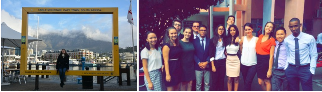
Souvenirs de deux matinées : l'une passée sur le front de mer de Cape Town, l'autre à la prépa d'oraux blancs à Bellepierre avec une partie de la promo ECS2 2014-2016